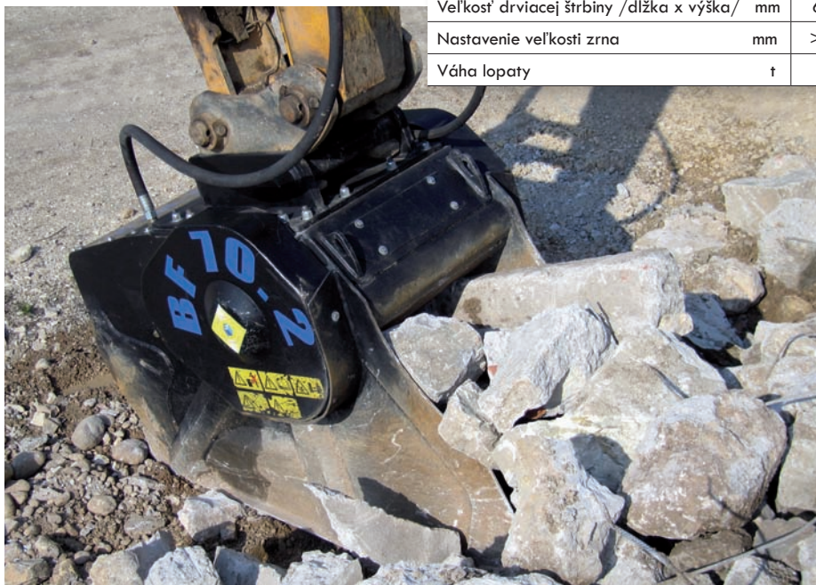
/Tab. 1/ MB SPA BREGANZE

ti od veľkosti lopaty a nastavenia drviacich čelustí, podrobnejšie údaje poskytuje /Tab. 1/. Samozrejme, musíme sa pozrieť na výkon, napr. najväčšia lopata BF 120.4 môže teoreticky dosiahnuť výkon až 50